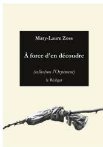
Couverture : Titus-Camell