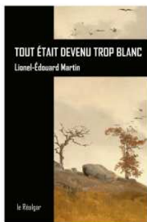
Couverture : Carl Friedrich Lessing