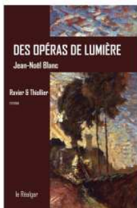
Couverture : Ravier