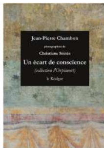
Couverture : Francis-Olivier Brunel